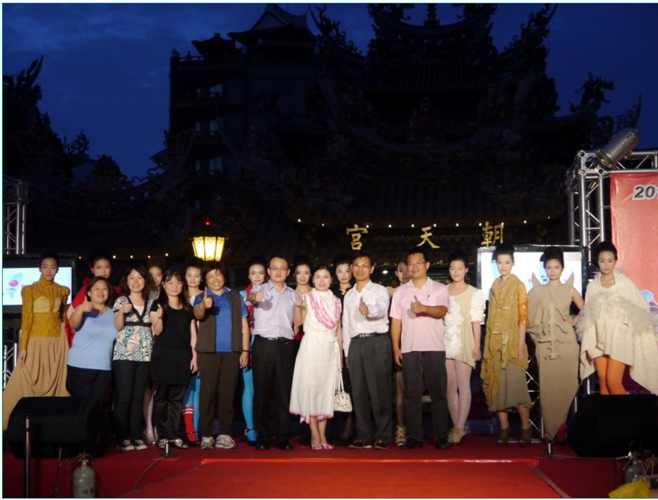
圖說：亞洲大學時尚設計學系獲紡織產業綜合研究所邀請，參加「臺灣製MT微笑產品展售會暨慶祝母親節」服裝動態展演，參與師生在台上合影留念。