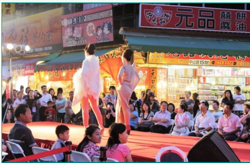
圖說：時尚系同學在雲林縣北港朝天宮前走秀，以全新、前衛性的創意概念，創造出服裝多元化的搭配性與功能性。