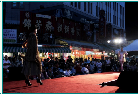
圖說：時尚系獲紡織產業綜合研究所邀請，參加服裝動態展演，展演的主題是「朝時尚悅曲」。