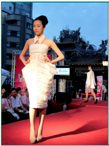
圖說：時尚系參加「臺灣製MIT微笑產品展售會暨慶祝母親節」服裝動態展演，同學在雲林縣北港朝天宮前走秀，受到注目。

時尚系參加「臺灣製MIT微笑產品展售會暨慶祝母親節」服裝動態展演，同學上台走秀，受到注目。